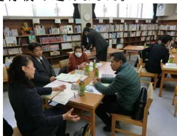
地域学校協働推進員中心