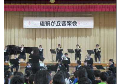
湯津上中吹奏楽部